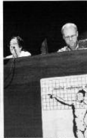
Una sessió d'Estudis de la Societat Andorrana de l'11 de novembre.

El debat sobre la crisi de valors és un tema de gran actualitat social. És el tema central de la Jornada d'Estudis de la Societat Andorrana de l'11 de novembre (JSAE), que es duu a terme a les 10 hores del matí a l'edifici de la Facultat de Ciències Socials de l'Andorra de la Universitat de Lleida.