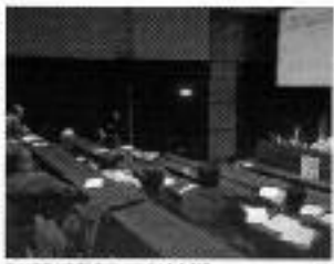
Una sessió d'Estudis de la Societat Andorrana de l'11 de novembre.

Després de la presentació de la jornada, els ponents de la jornada d'Estudis de la Societat Andorrana de l'11 de novembre (JSAE) es reuniran a les 10 hores del matí a l'edifici de la Facultat de Ciències Socials de l'Andorra de la Universitat de Lleida.