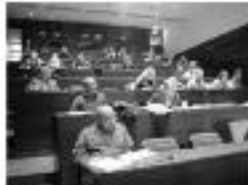
Fòrum acadèmic a la sala d'actes de l'Pau de Guàrdia