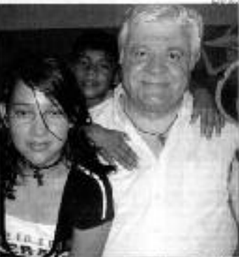
En el moment de la seva inauguració a Santa Cruz el 2008.

Una filla de 18 anys, que és una de les filles de la SAC. És una filla de 18 anys, que és una de les filles de la SAC. És una filla de 18 anys, que és una de les filles de la SAC. És una filla de 18 anys, que és una de les filles de la SAC.