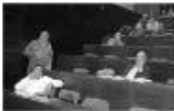
Fòrum d'història regional: les Illes Balears