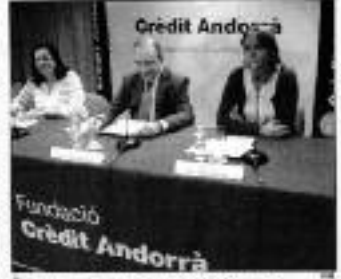
Les jornades sobre els valors de la SAC a Prada Casafit.

La sala d'òctics de Prada Casafit acollirà aquest dissabte la catorzena edició de les jornades de la Societat Andorrana de Ciències (SAC), que organitza ventaneres sobre els valors de la societat andorrana actual. A l'acte, que començarà amb el suport del Ministeri del Poder Judicial d'Andorra, hi participaran una vintena de ponents.