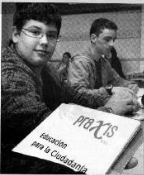
Alumnes de primer d'EGB de l'Institut de la Margalida a la classe de ciutadania. www.vecei.org