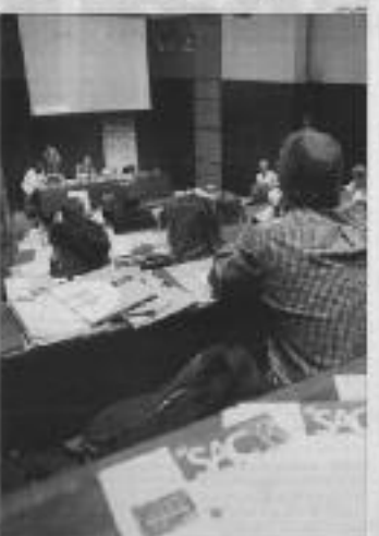
Agència Catalana de la Qualitat de la Gestió Pública, d'Alc.

Els andorranos valoren més l'afectiu que el poder En la seva última enquesta, el Centre d'Estudis de la Societat i de la Cultura de l'Andorra ha demostrat que els andorranos valoren més l'afectiu que el poder. Els joves andorranos conformen considerant la família com a valor i com a transmissor.